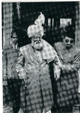
Hazrat Mirza Bashiruddin Mahmood Ahmad ra , Khalifatul Masih II verlaat de Mubarak Moskee in juni 1955