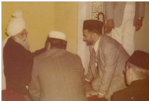
Hazrat Mirza Nasir Ahmad rh , Khalifatul Masih III binnen in de Mubarak Moskee