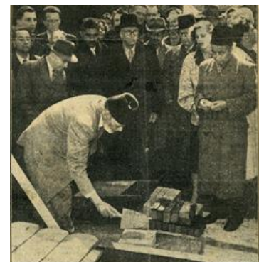
Sir. Ch. Mohammad Zafarullah Khan Sahib ra (in alle drie de afbeeldingen)

Eerste graaf-ceremonie van de Mubarak Moskee op 12 februari 1955