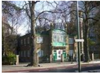
Enkele recente foto's van de Mubarak Moskee