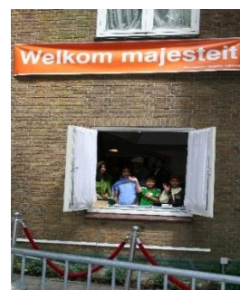
Paar foto's van de Mubarak Moskee tijdens de bezoek van Koningin Beatrix op 2 juni 2006