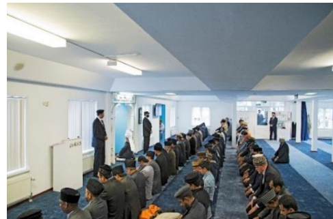
Hazrat Mirza Masroor Ahmad aba , Khalifatul Masih V staat de pers te woord in de Mubarak Moskee op 6 oktober 2015