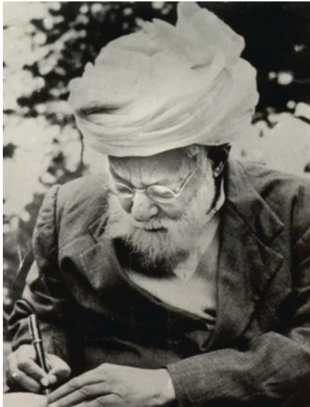
Hazrat Mirza Bashiruddin Mahmud Ahmad ra

Ladjna Ima'illah is de vrouwenorganisatie van de Ahmadiyya Moslim Djamaat. De vrouwenorganisatie werd opgericht in 1922 door Hazrat Mirza Bashiruddin Mahmud Ahmad, Khalifatul Masih II ra vanuit de visie dat vrouwen een gelijkwaardige rol dienen te spelen bij de opbouw van de Gemeenschap en de verbetering van de samenleving. De Khalifa riep de vrouwen op om met mannen te wedijveren in goede werken met behoud van de vrouwelijke identiteit.