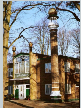
De eerste Moskee van Nederland (1955)